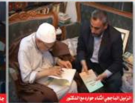
الزعيل الناجي أثناء حوار مع الدكتور