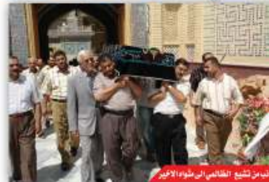
تقي الحكيم من تشيع الظالمي إلى شوال الأخير