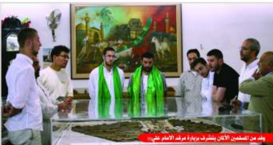
وفد من المستعدين الألمان يتشرف بزيارة مرقد الأمام علي