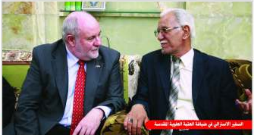
السنجر الأسترالي في ضيافة العتبة العلوية المقدسة