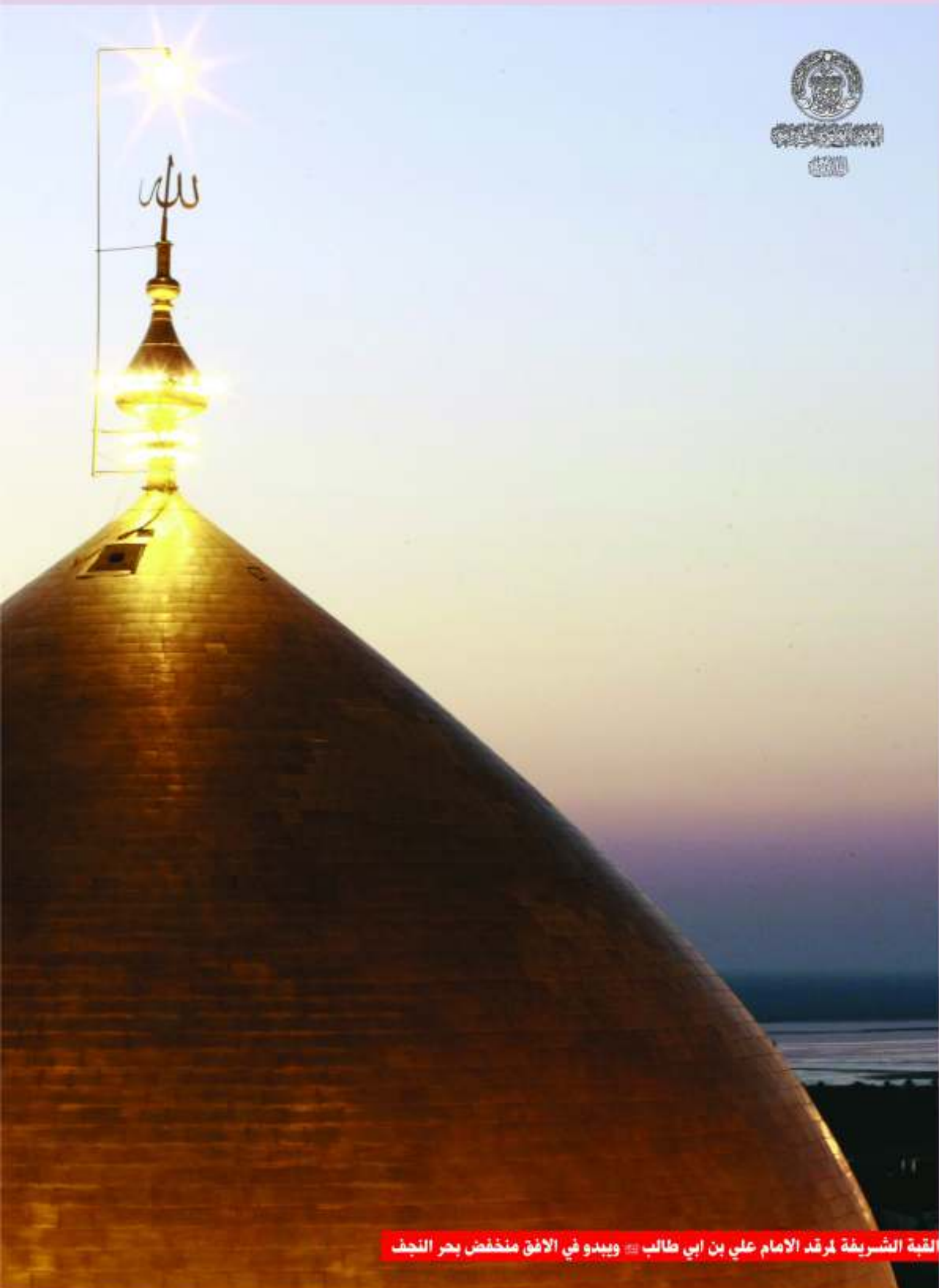
القبة الشريفة لمقر الامام علي بن ابي طالب عليه السلام ويبدو في الأفق منخفض بحر النجف