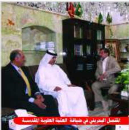
التصليح البحريني في ضيافة العتبة العلوية المقدسة