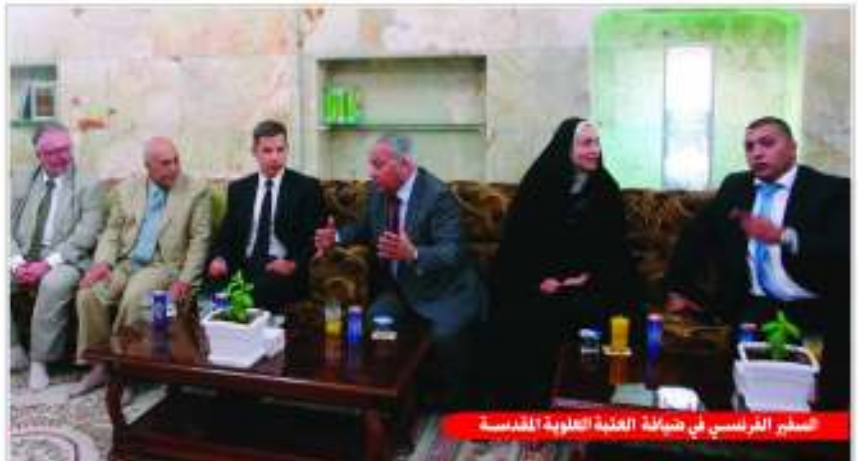
السنجر الفرنسي في ضيافة العتبة العلوية المقدسة