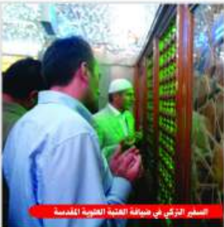
السنجر التركي في ضيافة العتبة العلوية المقدسة