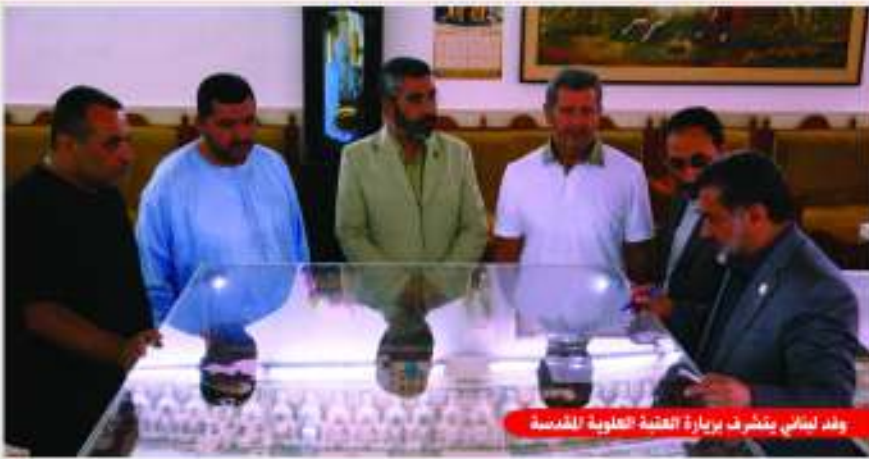
وفد لنادي يتشرف بزيارة العتبة العلوية المقدسة