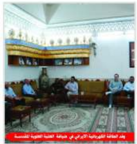
وفد الطاقة الكهربائية الإيرانية في ضيافة العتبة العلوية المقدسة