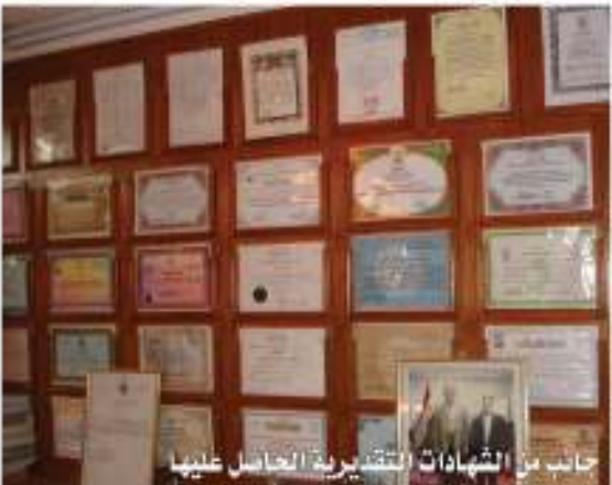
جانب من الشهادات التقديرية الحاصل عليها