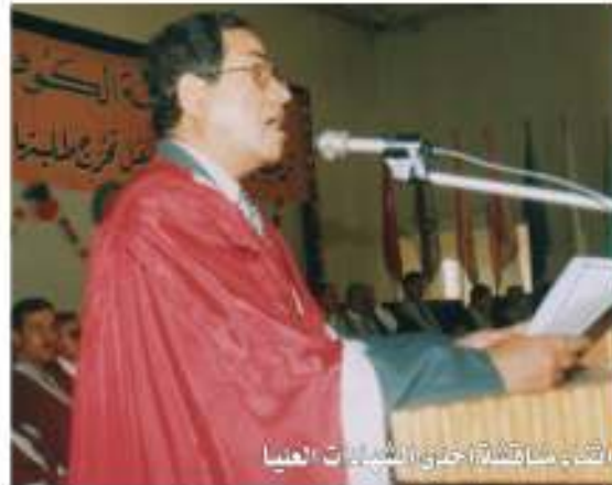
الشيخ الحكيم يفتتح ندوة في الساعات العظيمة

ولعل كتابي الأهم الأبرز وهي الموسوعة التي أتمنى في حياتي أن أكملها هو كتاب (المفصل)، طبعت منه (١٠) أجزاء وسوف أقوم بإصدار الأجزاء الأخرى تباعاً، وقد يصل بإذن الله إلى أكثر من (٢٠) جزء بحيث يشمل كل جوانب مدينة النجف الثقافية والعلمية والصحية والأدبية والجغرافية والتاريخية والحرفية من اللهجات والعادات والتقاليد والأسر والمكتبات... وحاولنا أن يكون نهاية التاريخ لهذه المحاور في مدينة النجف الأشرف هو نهاية عام ٢٠٠٠م لأنها نهاية ترف ونهاية حقبة تاريخية مهمة من تاريخ النجف بكل ما يحمله من إشراق وإبداع ومصاعب.